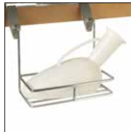
30016292 Urinflaskeholder (horisontal) *