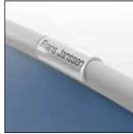
30016287 Navnelappholder i plexi