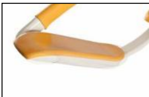
PVC beskyttelse på fotdel