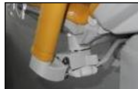
Göpels benholdere med og uten integrert lys