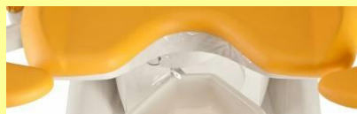
PVC trekk under sete