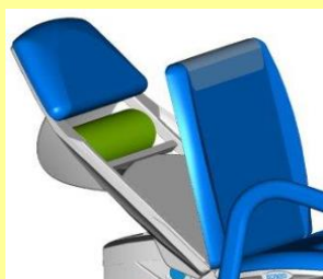
Integrert papirull (dekker bare rygg og sete)