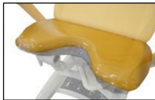
PVC beskyttelse på setedel