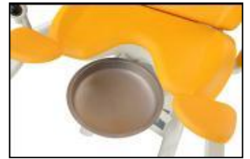
Rusfritt stål, speilvendt