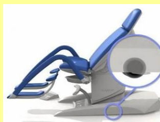
Integrert hjul for å flytte stolen