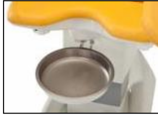
Rusfritt stål 4,5 l