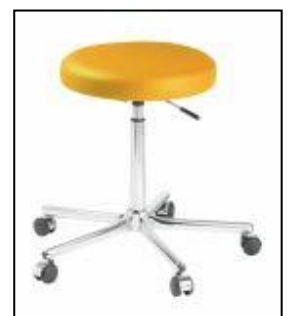
Standard stol med løft