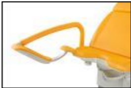
Fot/benstøtter ned og uten integrert lys