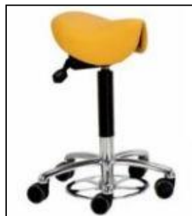
Sadelstol med løft