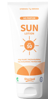
SUN Sollotion spf 50 12 x 75 ml artnr: 4353