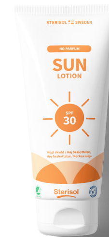
SUN Sollotion spf 30 12 x 200ml artnr: 4352

Solskyddsfaktorn syftar till att berätta hur hög grad av skydd produkten ger och därmed hur bra du är skyddad mot den skadliga UV-strålningen. Det finns individuella skillnader i hur väl man tål solen, men en högre solskyddsfaktor ger bättre förutsättningar. Ju högre SPF desto längre gäller skyddet och du kan vistas längre i solen. Sterisol SUN Lotion har SPF 30 samt 50 vilket betyder att du kan vistas trettio respektive femtio gånger så länge i solen utan att bränna dig.