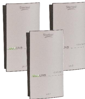
Art. nr 1530 / 1533 / 1536