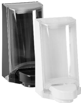
Art. nr 4552 / 4551

Exempel på dispensers för 375 och 700 ml systemen