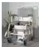
Dusj og toalettstol Palima