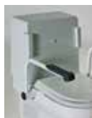
Armstøtte TCL integrert