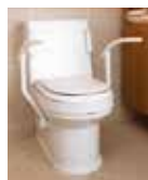
Armstøtte integrert Palma