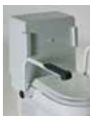
Armstøtte TCL integrert