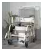
Dusj og toalettstol Palima